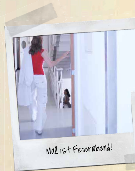
Mal ist Feierabend!