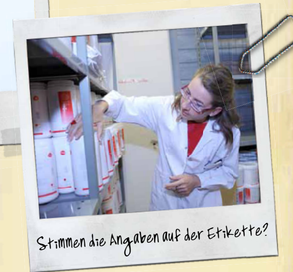
Stimmen die Angaben auf der Etiketete?